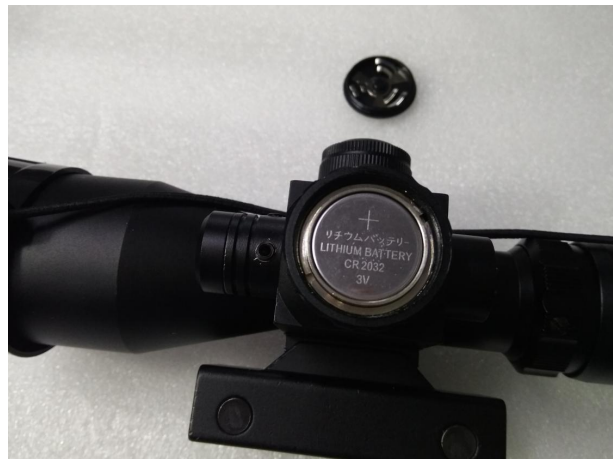
图 4 更换内部照明供电纽扣电池

如果瞄准器内部红绿照明亮度不足请用一字螺丝刀拆开电池仓（内部照明旋钮开关处），该电池为型号为 CR2032。