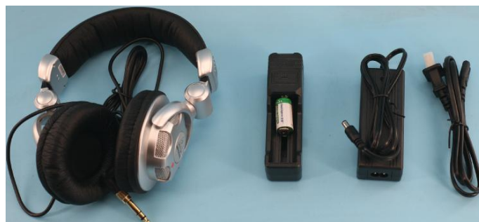
图 6 充电器以及耳机

本仪器配备主机充电器、激光器 16340 锂电池专用充电器以及高降噪耳机。请使用仪器配备的专用充电器进行充电以免造成仪器或者电池损毁！