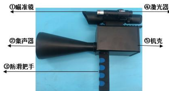
图 1 主机侧视图