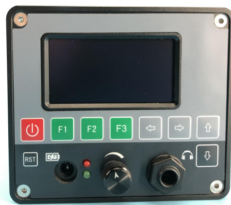
图 2 主机前面板图示