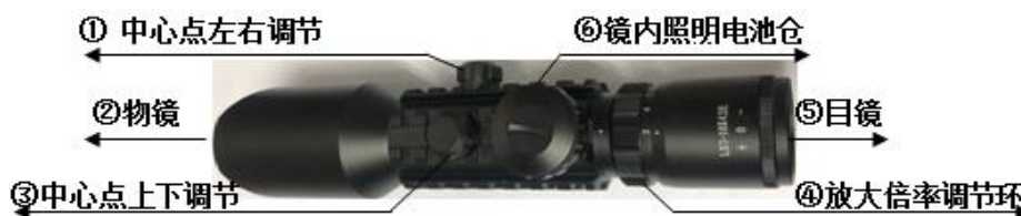
图 3 远程瞄准镜

该瞄准镜能调节适度、防雾, 内部照明方式分为红绿灯各 5 档位。镜内照明电池仓上面旋钮转动时能调节镜内亮度以及红绿色, 当不需要镜内照明时请将旋钮调至关闭