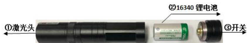
图 5 激光器拆解图

激光器安装在远程瞄准镜左侧，按下开关可以打开激光器，当激光器亮度不足时需要及时为 16340 锂电池充电以免影响使用，安装 16340 电池要注意按照图 5 区分正负极性（正极朝向开关侧），否则容易损坏激光器！